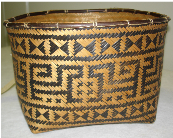
Figura 5: Cesto wayana com grafismos de múltipla representação, animal e sobrenatural. Foto: Lucia van Velthem, 2007.

2005). São assim desenvolvidas práticas que objetivam facilitar a transformação de um corpo para dotá-lo das qualidades sociais requeridas, assim como para modificar sua natureza e seu aspecto. Através de técnicas variadas e complexas são efetivadas amplas mudanças corporais, algumas das quais relacionadas a uma elaboração estética, geralmente reunidas sob a expressão “decoração” corporal. A elaboração do corpo é produzida tanto por pinturas de base vegetal – o vermelho vem do urucu, o negro, do jenipapo – como por tatuagens, escarificações, adornos plumários e de outros materiais, e também pelo corte de cabelo. Constituindo parte essencial do processo de transformação da pessoa, essas técnicas comunicam diferentes intenções e são específicas de cada povo indígena.