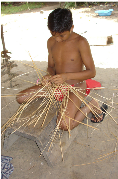
Figura 4: Menino tecendo o grafismo “olho do gavião real”.

des serpentes amazônicas, jibóia e sucuriju, enquanto “mestres” ou “donos” originais dos sistemas gráficos de diferentes povos indígenas, destacando-se os de língua carib. (Figura 4)