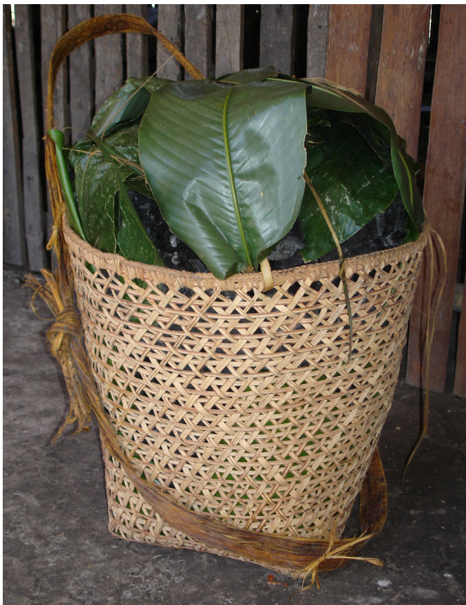
Figura 2: Cesto cargueiro dos Baré. Feito de cipó ambé, envira e com trançado “olho de piaba”.

pois expressam tantas formas quantos são os povos que as produzem. Um ar familiar, facilmente perceptível através das matérias-primas empregadas, do aspecto formal de certos artefatos perpassa, entretanto, as artes indígenas, tornando-as distintas das produções de outras sociedades (RIBEIRO, 1987, p. 332).