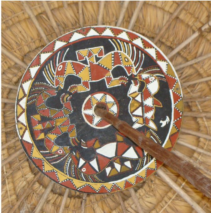
Figura 3: Roda de teto de casa cerimonial dos Wayana e Aparai com representações de serpentes sobrenaturais.

um longo aprendizado. Assim, observa-se que a maestria técnica e artística está invariavelmente acompanhada de profundo conhecimento das narrativas míticas e das práticas rituais, constituindo domínios estreitamente associados (GUSS, 2003). Para muitos povos da Amazônia, a origem mítica da arte gráfica é atestada, evidenciando sua vinculação com seres específicos que remetem às cosmologias, teorias nativas globalizantes.