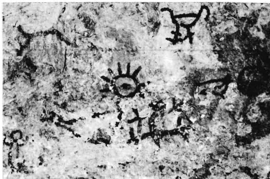
Figura 4 - Sítio PA-MT-1: Pedra do Mirante. Grafismos reconhecidos com o corpo preenchido totalmente (parte centro-inferior da foto) e apenas contornado (parte inferior à esquerda da foto).