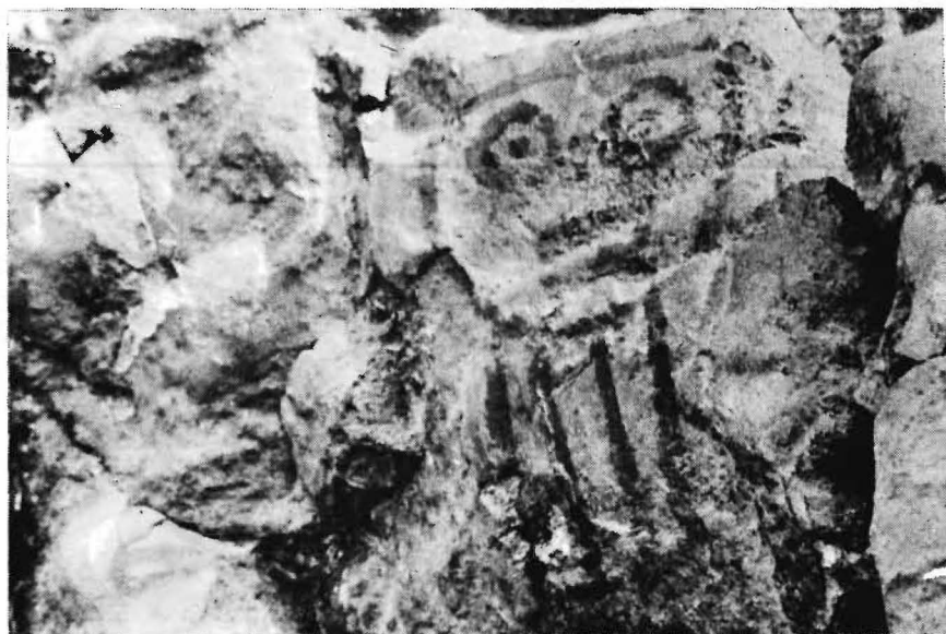
Figura 6 - Sítio PA-MT-4: Serra da Lua. Representação de um rosto.