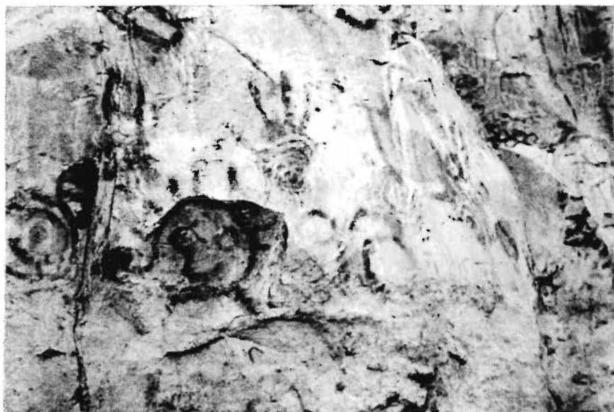
Figura 5 - Sítio PA-MT-4: Serra da Lua. Mãos em positivo e a representação de um rosto elaborado no interior de um nicho natural da rocha.