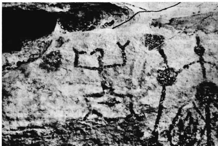
Figura 3 - Sítio PA-MT-3: Pedra do Pilão. Figura antropomorfa cujos traços da cabeça são semelhantes àqueles da Subtradição Seridó (Tradição Nordeste).