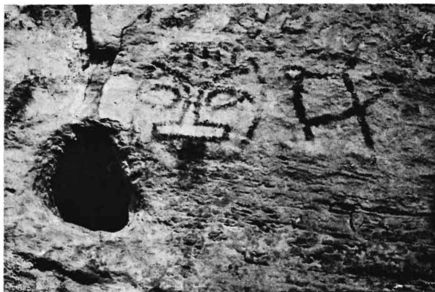
Figura 7 - Sítio PA-MT-4: Serra da Lua. Representação de um rosto.