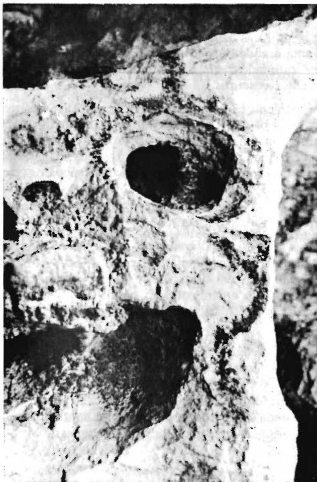
Figura 10 - Exemplo do aproveitamento das formas naturais da rocha para execução de pinturas. Nesta foto observa-se uma cavidade da rocha que foi contornada com pintura vermelha.

Algumas particularidades, a nível da apresentação gráfica, puderam ser verificadas na área, como a ausência de movimentos das representações antropomorfas e zoomorfas e o preenchimento do corpo de algumas destas figuras com traços geométricos. As representações de rosto e as mãos em positivo apresentam-se também como grafismos próprios da área.