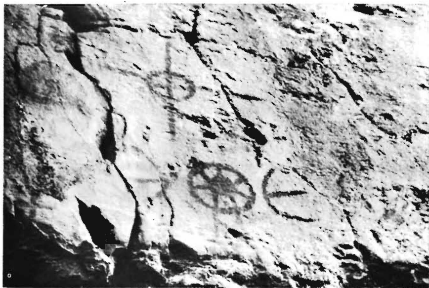
Figura 9 - Sítio PA-M T-4: Serra da Lua. Grafismos não reconhecidos.