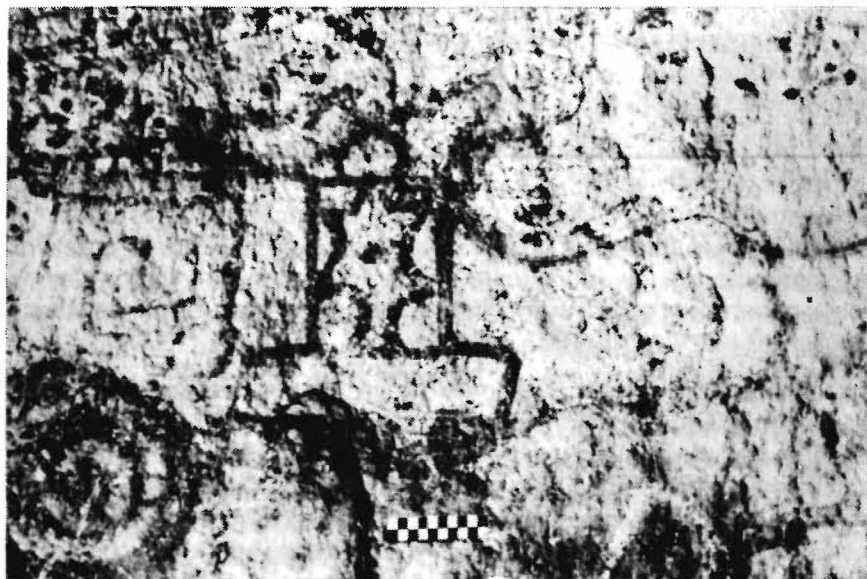
Figura 2 - Sítio PA-MT-2: Gruta do Pilão. Figura antropomorfa com o interior do corpo preenchido com formas geométricas.