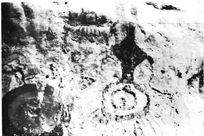
Figura 8 - Sítio PA-MT-4: Serra da Lua. Grafismos não reconhecidos comuns na região de Monte Alegre.