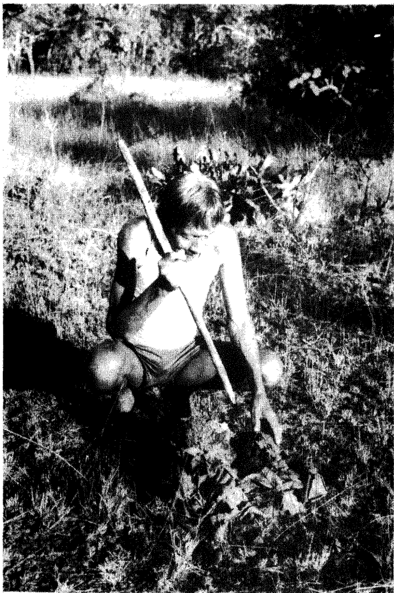
Figura 2 - O informante Beptopoop macerando o material orgânico que serve como substrato na formação de apêté no campo.