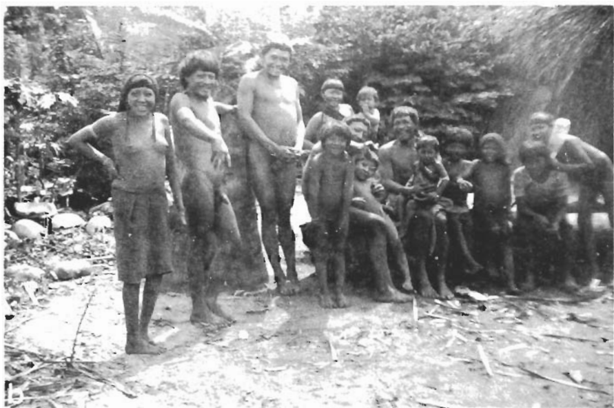
Est. 1 — a) Vista parcial da aldeia Araweté, vendo uma maloca ainda em construção; b) Um grupo de índios Araweté.