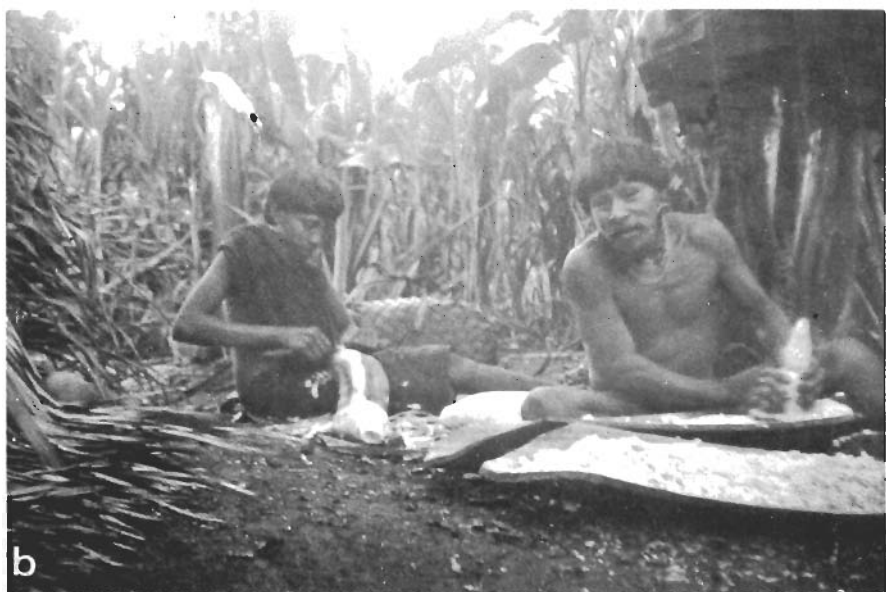
Est. II — a) Casal de índios Araweté; b) Casal de índios Araweté raiando mandioca. (Fotos J. Carvalho, 1977).